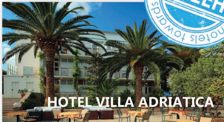
HOTEL VILLA ADRIATICA